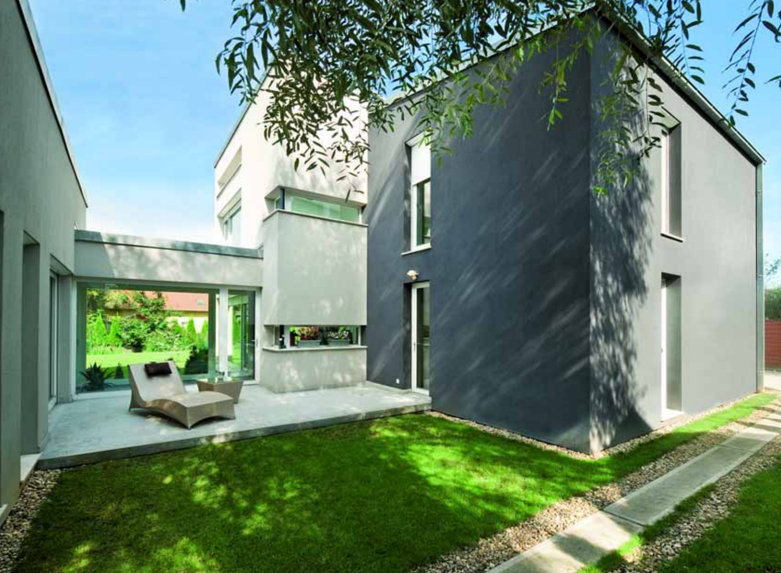
Az átriumszerű belső udvar meghitt pihenőhely, ahol erős napfénynél is találni árnyékos részt.