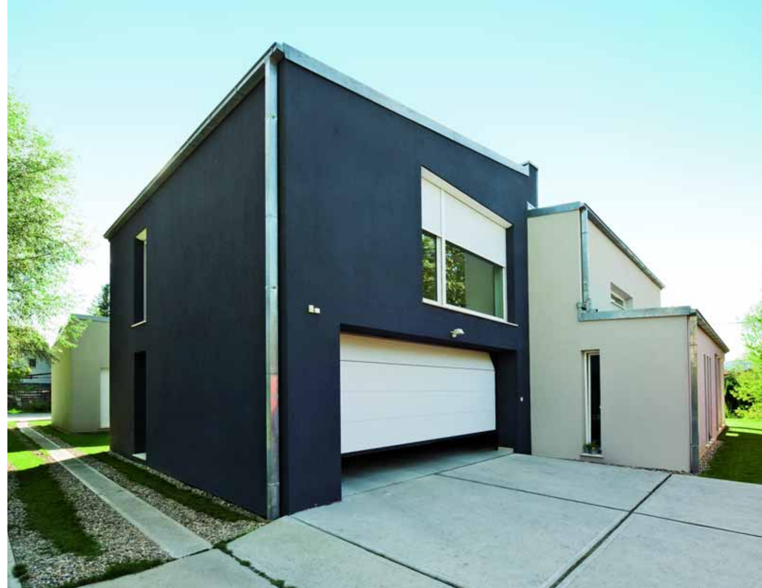
A dupla széles garázs a hátsó udvartól közelíthető meg, hogy bejárata ne uralja az utcai homlokzatot.