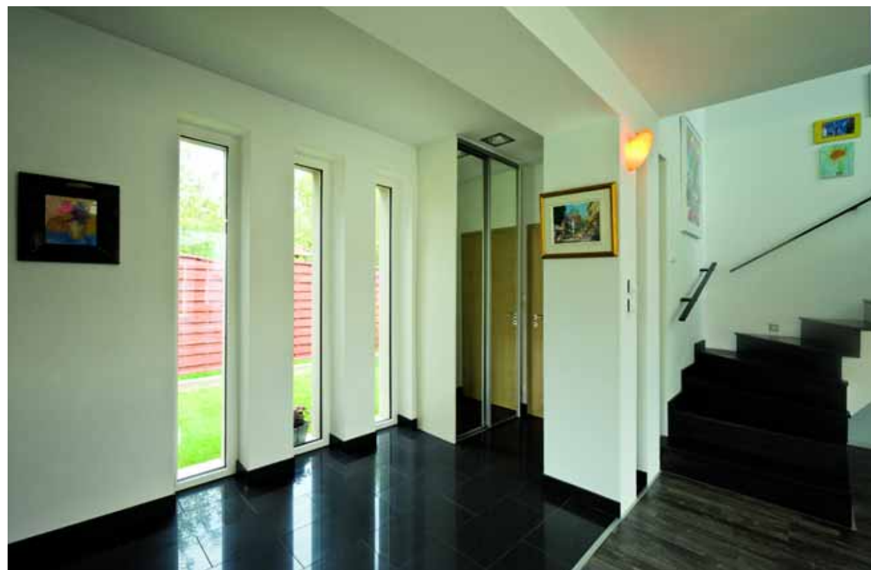
Az előszoba és a nappali közös légterű, csak padlóburkolata jelzi az elkülönülést.

A környező épületek építészetileg elég vegyes képet mutatnak. A főépítésznek és a város vezetésének köszönhető, hogy az épület ilyen formában megvalósulhatott.