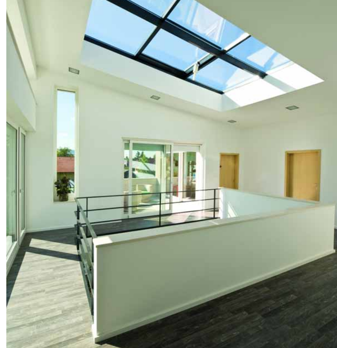
A tetősíklablakkal bevilágított galériához csatlakozik egy nagyméretű intim terasz.