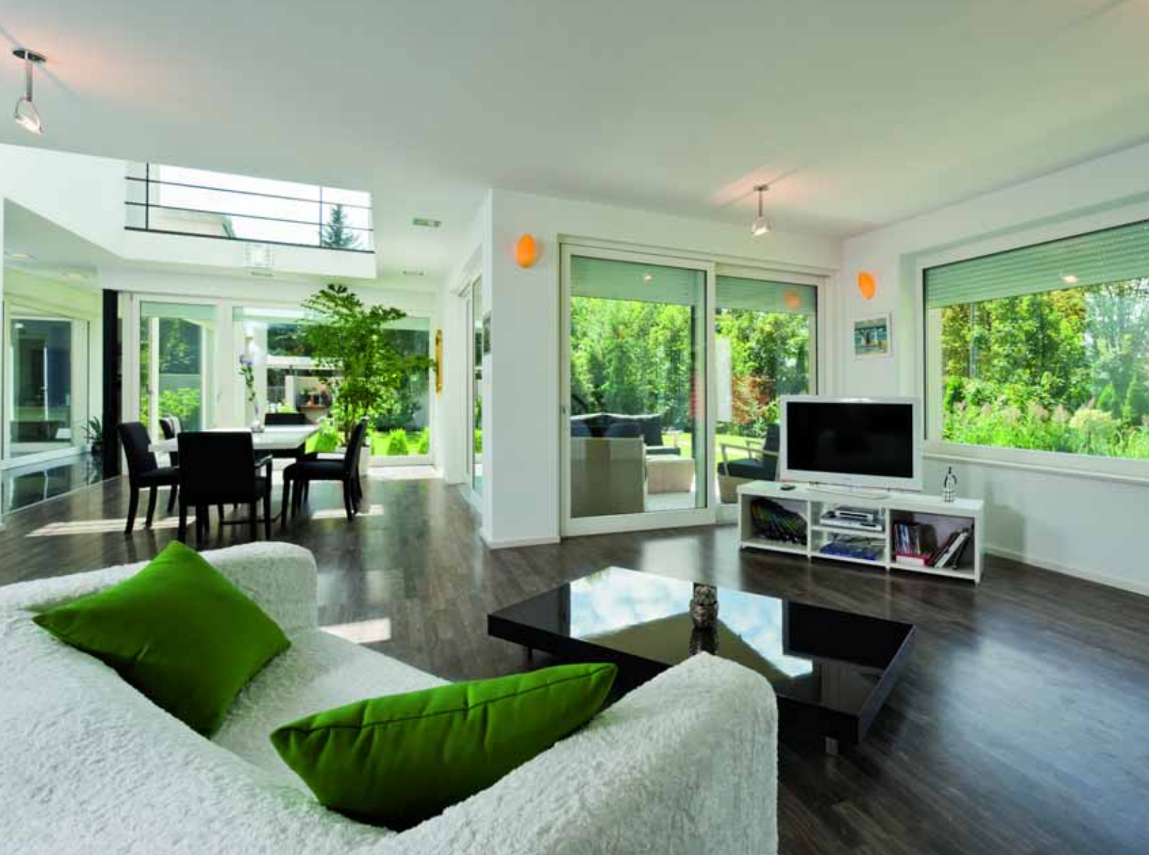
Az átlósan elhelyezett, sima vonalú bútorok és a minden irányban látható természetközelség megnövelik a nappali terét.