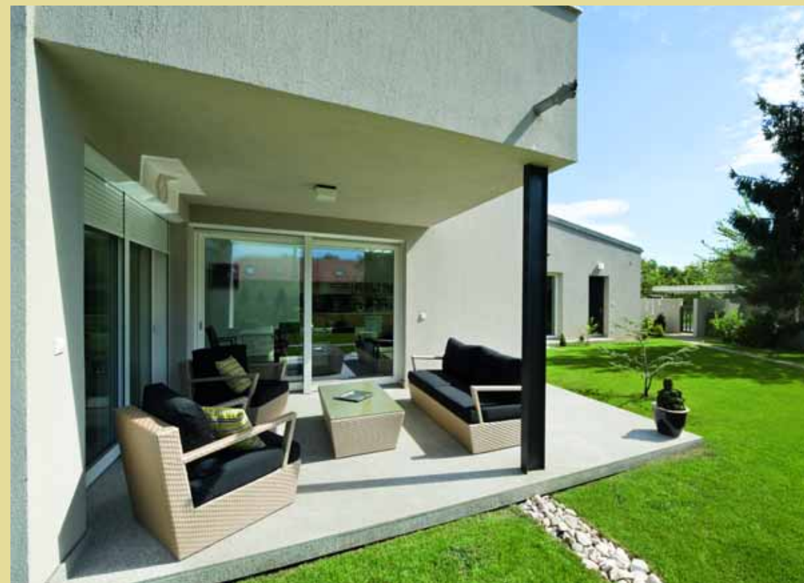
A fedett terasz légies hatású, csak egy karcsú acélpillér támasztja alá.

Mivel a nappalihoz és az étkezőhöz csatlakozik a fedett terasz és a kert, ezek kora tavasztól késő őszig a kellemes pihenés, a szabadtéri étkezés lehetőségét nyújtják a családnak és vendégeinek.