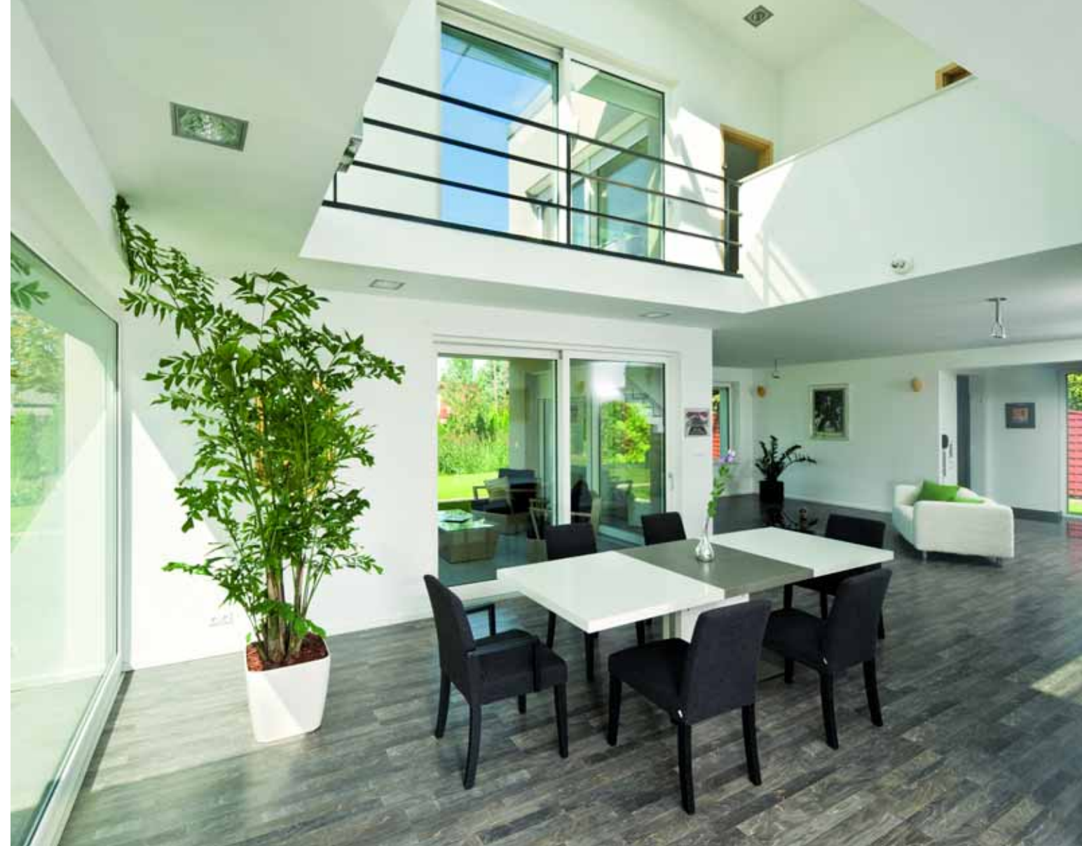
Az épület központjában, a galériás térben kapott helyet a nagy létszámú vendégfogadást is lehetővé tevő étkezőgarnitúra.