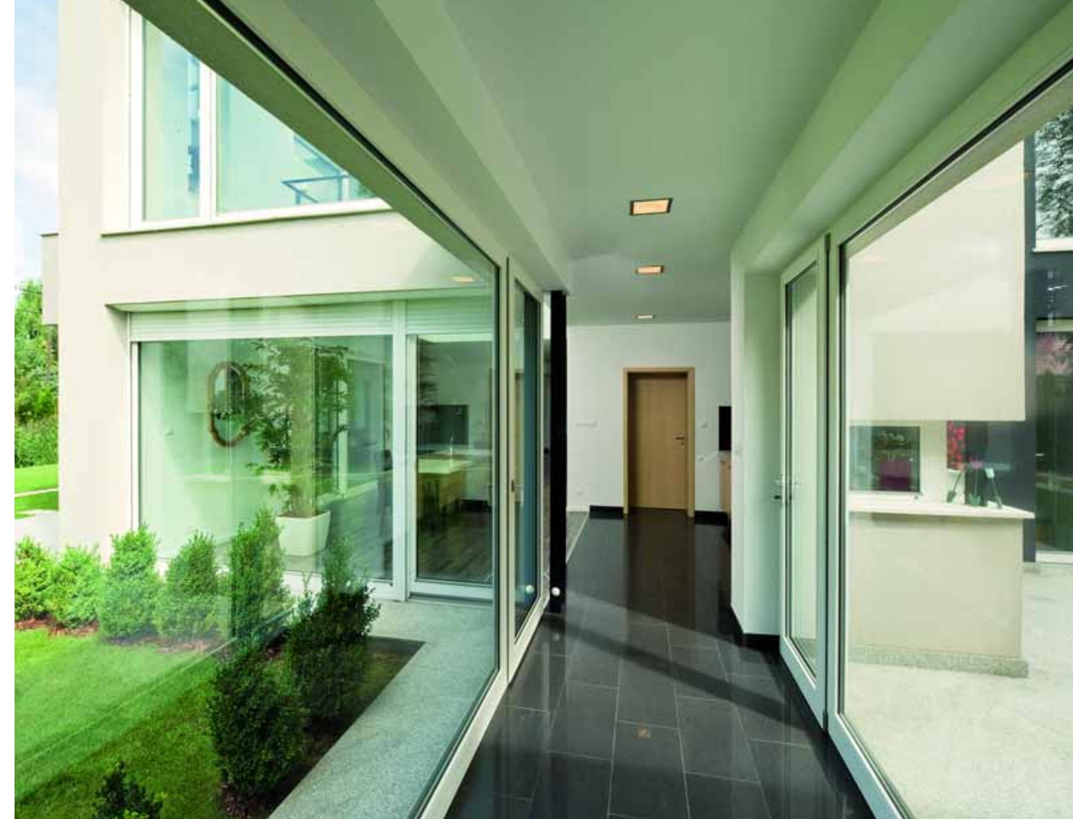
A lakóegységet a dolgozó- és vendégszobával összekötő üvegfalú közlekedő a ház leglátványosabb része.